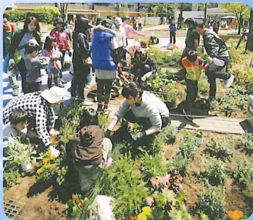
植栽でコミュニティ