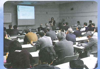
様々なテーマを扱う勉強会