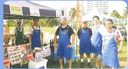
地域のお祭りでコミュニティ