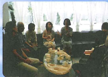
お茶会でコミュニティ