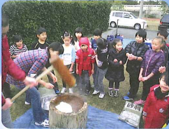
季節行事でコミュニティ