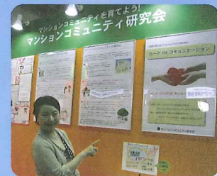
展示会へも出させてもらっています