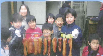
ベーコンづくりでコミュニティ