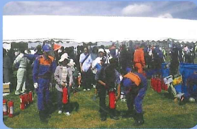
防災訓練でコミュニティ