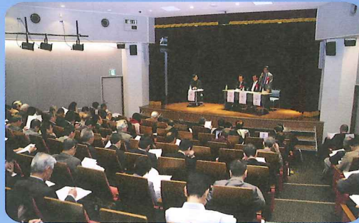
年2回開催のフォーラムは大盛況です