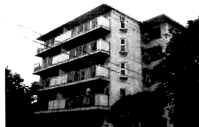
<写真-右>専有部分の増築部分